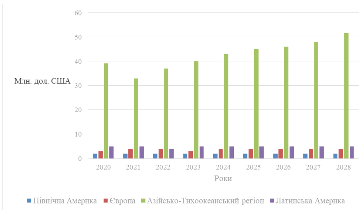
Рис. 2. Прогнозований ріст доходів міжнародного ринку чаю за регіонами світу*