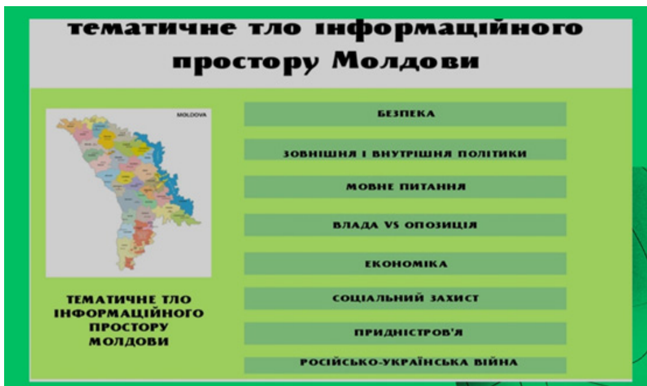
Рис. 1. Тематичні площини молдовського інформаційного простору (Розробка автора)

У молдовському інформаційному просторі маємо велику кількість нових медіа, які поширюють наративи серед своїх читачів – пересічних громадян, формуючи своєрідне відчуття політичної дійсності та ставлення до цієї дійсності. Головними тематичними площинами є такі: безпека, офіційна мова, зовнішня й внутрішня політики, влада та опозиція, економіка держави, соціальний захист, російсько-українська війна, Придністров'я (курсив – наш).