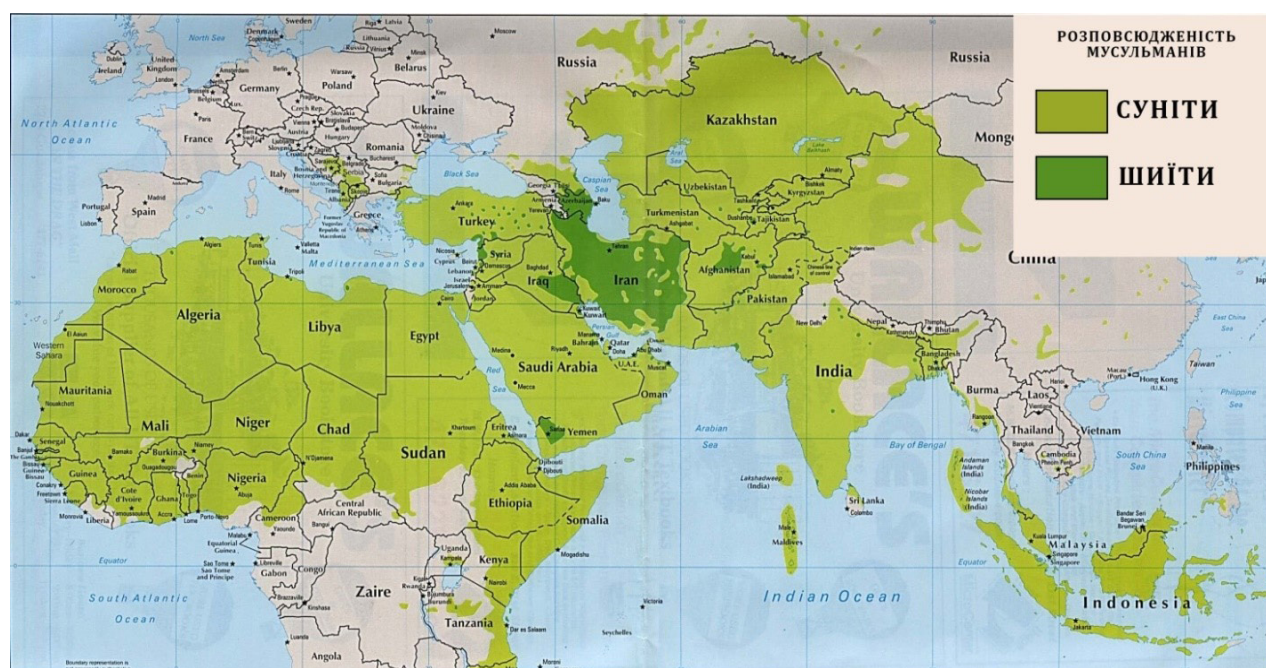
Рис. 1. Географія поширення сунітів і шиїтів у світі [3]

Ще одним фактором, який вплинув на виникнення терористичного