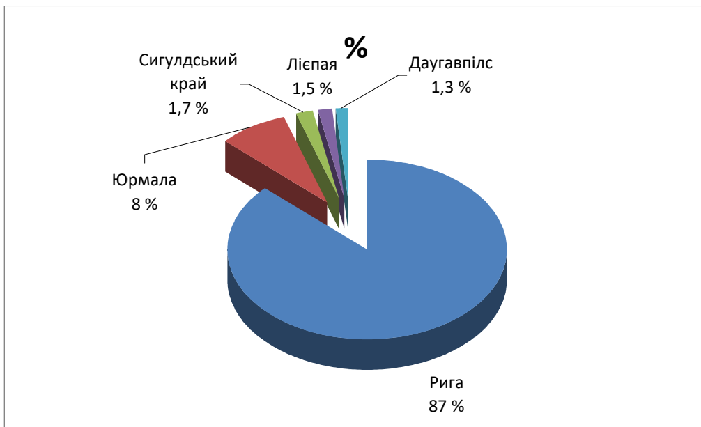
Рис. 2. Популярні міста Латвії серед зарубіжних туристів

Туристи, які приїжджають у Ригу, приносять економіці країни приблизно 500 млн євро.