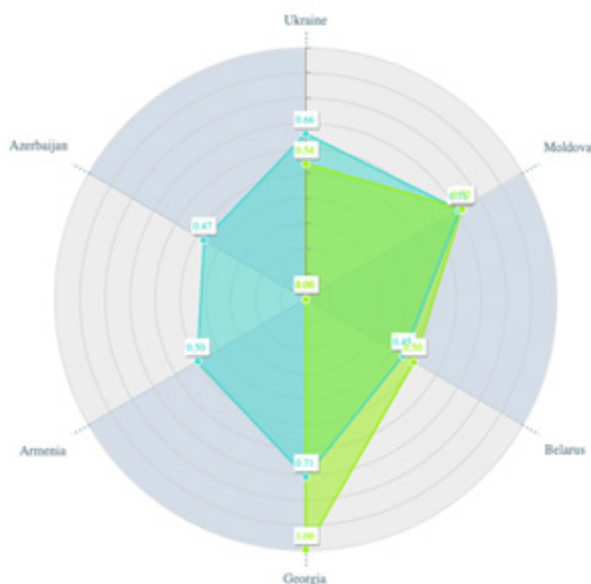
Графік 3. Кореляція індексу «СХП» і підіндексу «Фінансування ЄС безпекових проєктів» (2020–2021 рр.) [19]

зумовлено відсутністю політичної волі до інтеграції в ЄС, а також значним впливом РФ на ці країни.