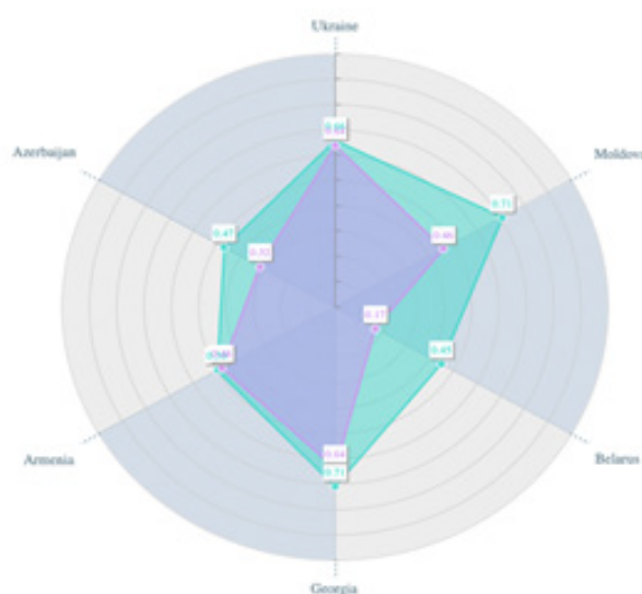
Графік 1. Кореляція індексу «СХП» і підіндексу «Міжнародна співпраця у сфері безпеки» (2020–2021 рр.) [10]

Одним із ключових елементів співпраці ЄС і країн Східної Європи є ініціатива ЄС «Східне партнерство». Із метою аналізу ступеня інтеграції співпраці країн Східного партнерства важливим є аналіз індексу Східного партнерства, який показує ступінь наближеності стандартів країн регіону до європейських. На графіку 1 відображено кореляцію індексу «СХП» та підіндексу «Міжнародна співпраця у сфері безпеки» (2020–2021 рр.). Згідно з цим показником бачимо досить хороші позиції (середнє значення) в Україні, Грузії та Вірменії. Ці показники також корелюються із загальним значенням індексу Східного партнерства цих країн. Дещо нижчими є показники в Республіках Молдова й Азербайджан. Також