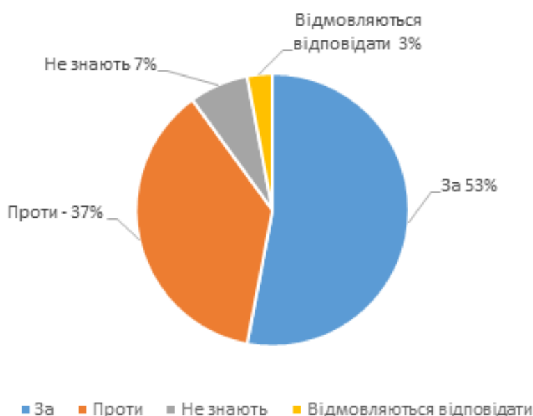
Рис. 3. Результати опитування громадян ЄС–27 щодо подальшого розширення Союзу та включення нових держав [28, р. 8]

Після початкового вияву символічної єдності Європи, яка заявила у 2022 р. про свою підтримку України та демократичних цінностей, відкривши перспективу прискорення євроінтеграції, нинішній етап викликає жваві дискусії щодо інституційних, фінансових і політичних наслідків, випробуючи цілісність та згуртованість ЄС. І серед ключових проблем, які гальмуватимуть розширення євроблоку, будуть не лише територіальні конфлікти в країнах-претендентах, а й перерозподіл ресурсів і можлива зміна балансу сил у ЄС між новими та старими членами. Зрештою – здатність наявної інституційної структури поглинути нових членів.