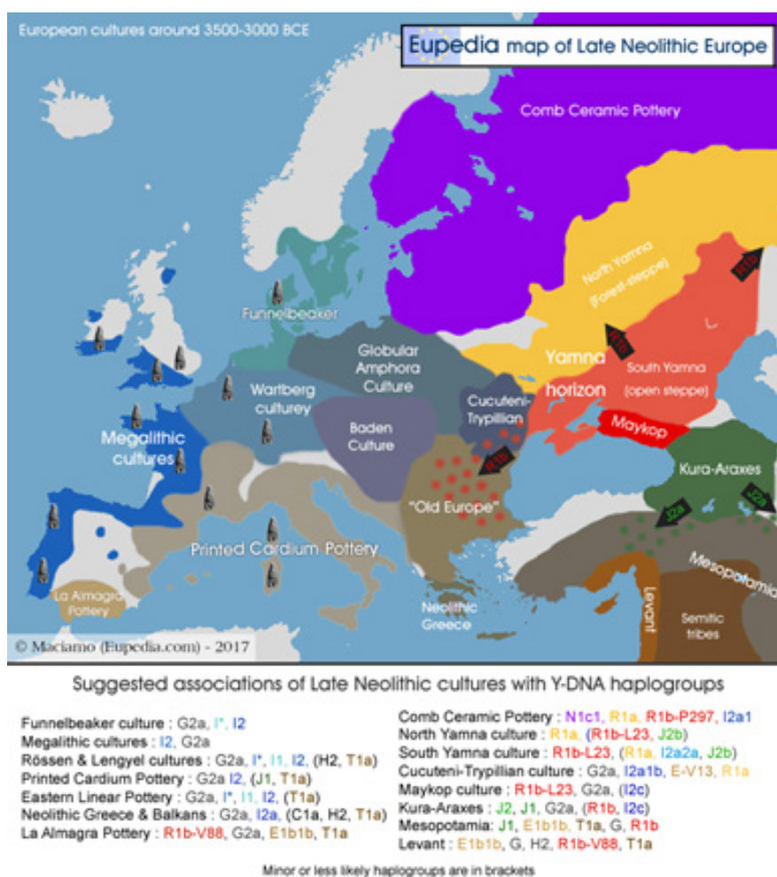
Рис. 2. Карта неолітичних культур бл. 5500–6000 років тому [2]

Цивілізація Старої Європи з її укріпленими поселеннями, храмами й розвиненою релігією досягла розквіту в неоліті та мідному віці. Із кінця VI до початку III тис. е. кукутенсько-трипільська культура була східним кордоном Старої Європи. Коли в другій частині V ст. до н. е. зникли цивілізації Вінча й Караново, Трипілля протягом 1000 років продовжувало