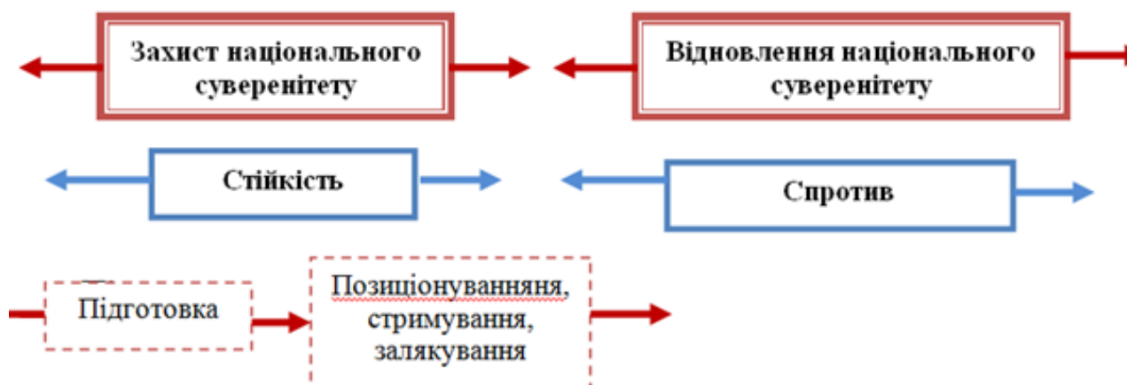
Рис. 1. Синергетичний зв'язок між національною стійкістю та національним спротивом

Для моделювання національного спротиву українського суспільства будь-якій зовнішній агресії чи окупації важливим є опертя на ідею ROC про взаємозалежність між національною стійкістю та національним спротивом (рис. 1). Стійкість суспільства в її інституційному й ціннісному вимірах сприяє стримуванню потенційної окупації та посилює систему національної оборони в її протидії поваленню національного суверенітету та його відновлення: «За своєю суттю, стійкість – це бажання людей зберегти те, що вони мають; бажання та здатність протистояти зовнішньому тиску й впливам та/або позбавлятися від наслідків цього тиску чи впливу» [22].